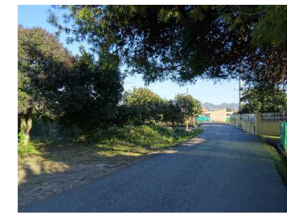
Camí Donació 1 2 3 4 5