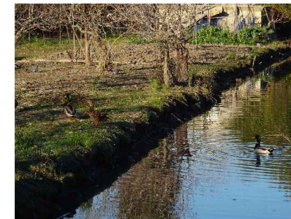
Marjal de interés ambiental 1 2 3 4 5