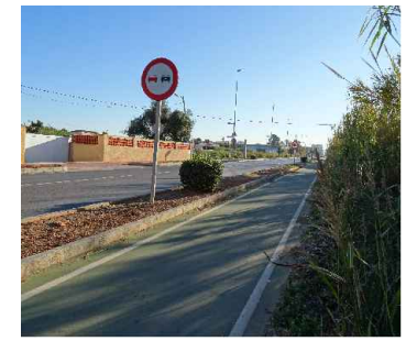
Carril bici Avd. Hermanos Bou 1 2 3 4 5

En una escala del 1 al 5, siendo el valor 1 el de menor valor y el 5 de mayor valor, respecto a las siguientes imágenes, ¿cómo se ajustan al paisaje que te gustaría tener en tu entorno?