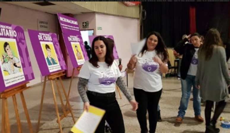
Taller de micromasclismes