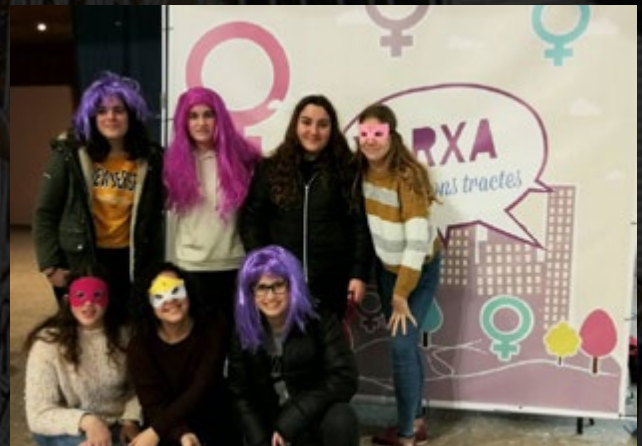
Joves participants en les activitats organitzades per la Xarxa pels Bons Tractes