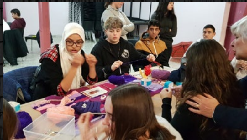
Joves fent peces de cadeneta