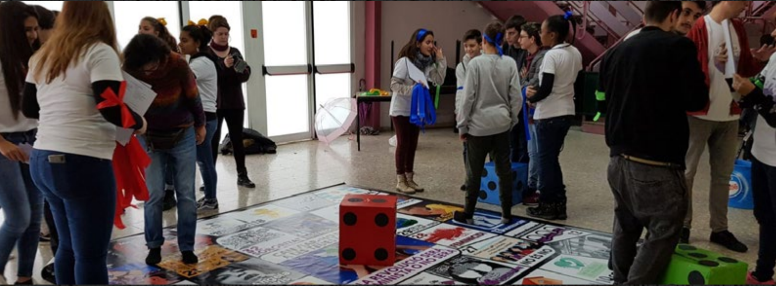
El joc de l'oca feminista