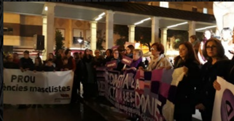
Manifestació contra la violència masclista