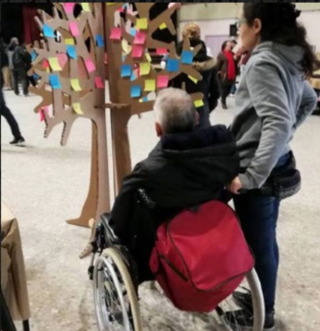
L'arbre dels desitjos per a una societat no masclista