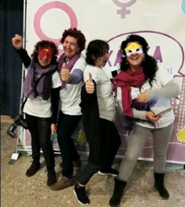
Xarxa Feminista pels Bons Tractes