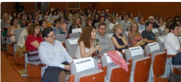
Públic assistent a la trobada sobre el pressupostos