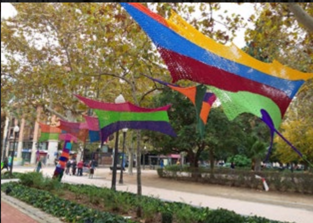
El Passadís de les Arts decorat amb les peces de cadeneta