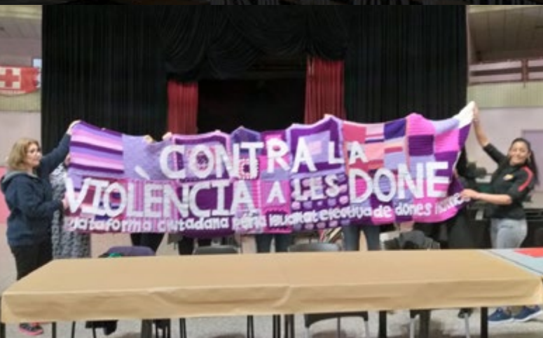
Plataforma ciutadana per la igualtat efectiva de dones i homes