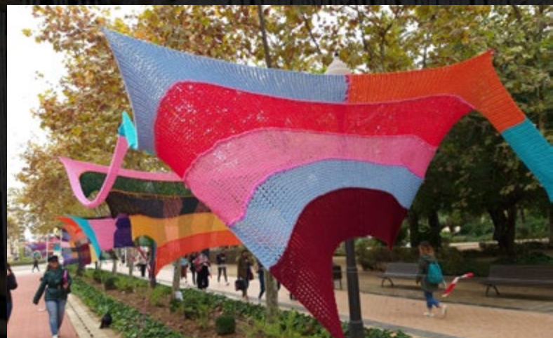
El Passadís de les Arts decorat amb les peces de cadeneta