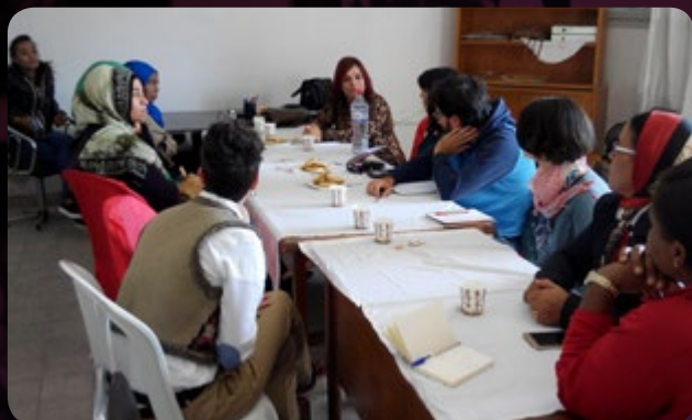
Reunió amb l'organització tunesina de desenvolupament

amb una dinàmica continuada de participació local i, sobretot, amb moltes ganes de compartir les seues experiències amb altres dones, tant de Tunísia -país amb qui tinguérem l'oportunitat de participar en un intercanvi d'experiències- com de pobles d'altres comarques".