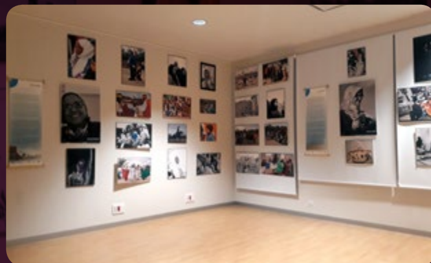
Exposició al Menador Espai Cultural

Equip Assemblea de Cooperació per la Pau-País Valencià