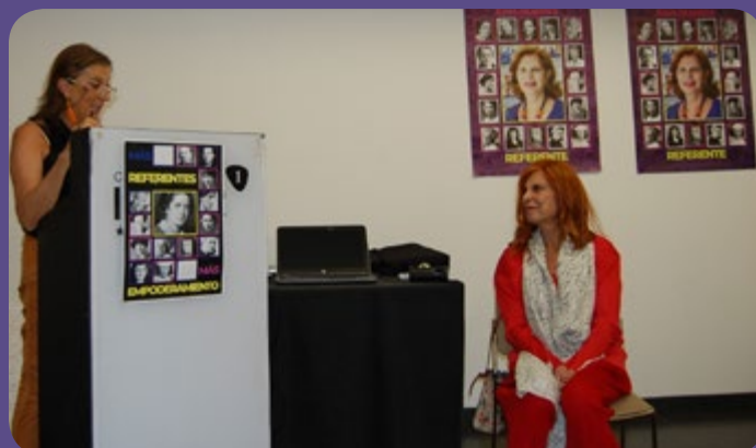
Carmen Alborch, distingida com a referent en la lluita per la igualtat

A més, Alborch va ser homenatjada durant la primera jornada de l'esdeveniment i distingida com a referent. En aquest homenatge es van crear grups de treball, els quals havien d'escriure un manifest argumentant per què Carmen Alborch havia de ser un referent; manifestos que després es van llegir i van defensar en veu alta. Alborch, morta el 24 d'octubre de 2018, queda en l'imaginari col·lectiu la seua lluita incessant i el seu referent dins del feminisme.