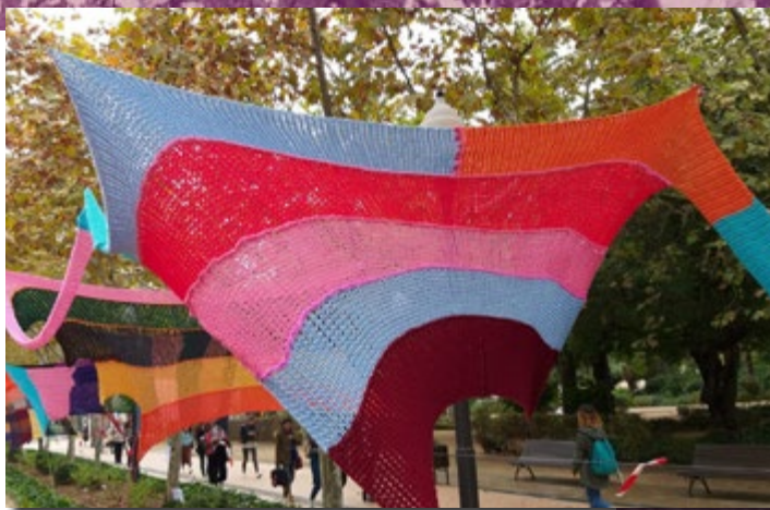
El Passadís de les Arts engalanat amb les peces teixides a mà

Però, a més, i com a novetat d'enguany, un grup d'associacions de dones ha creat la