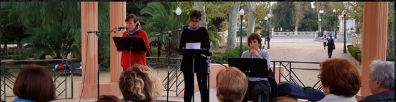
Grup de teatre La Ravalera