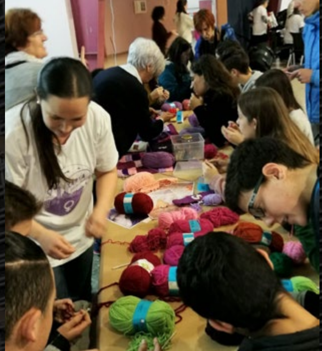
Taller feminista amb peces de cadeneta