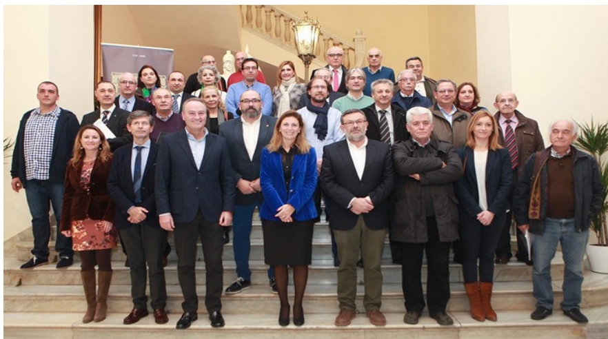
Foto de la sesión constitutiva del Pleno del Consejo el 27 de enero de 2016

La composición del Pleno del Consejo es la que se establece en el artículo 7 del mencionado Reglamento, en las que están las principales organizaciones sociales, profesionales y de vecinos más representativas y de aquellas instituciones más relevantes con sede en la ciudad.